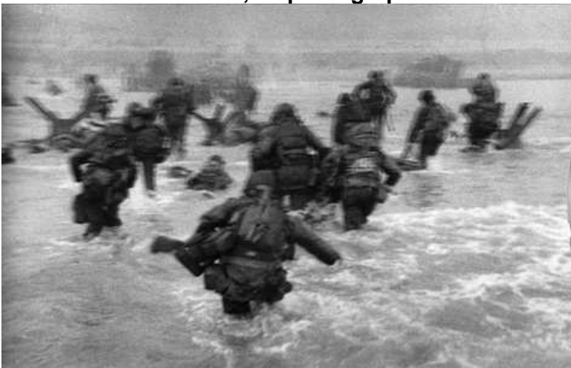
D DAY .

Sur la dernière bobine, 11 photographies resteront le témoignage unique de cet événement