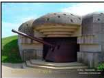
Le Mur de l'Atlantique