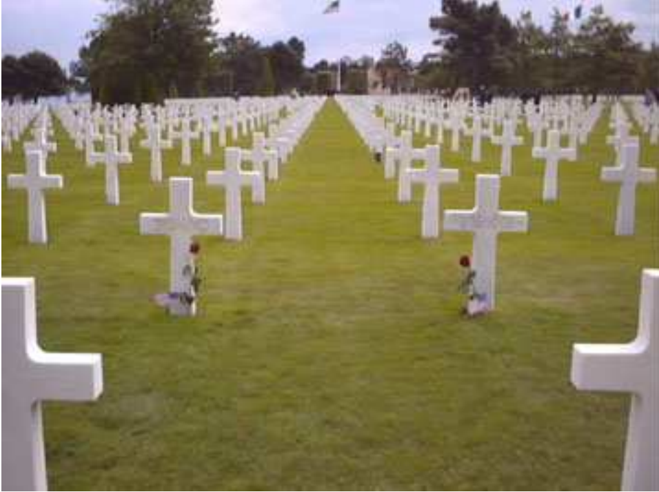
Cimetière Américain de Colleville Sur Mer en Normandie.