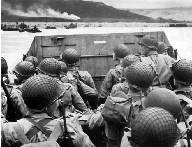
BARGE DE DEBARQUEMENT