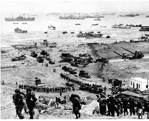
Bataille de Normandie