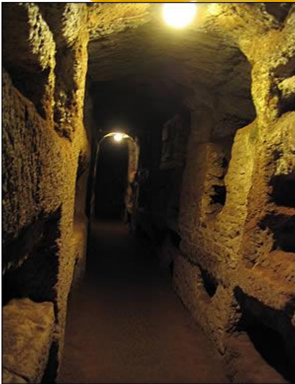
catacombes Via Appia Antica Rome

*ils utilisent des symboles gravés sur les murs en signe de reconnaissance.